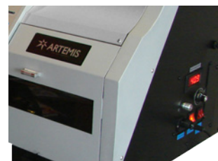
Panel sterowania suszarkami