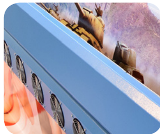
2 grzałki: IR + wentylatory