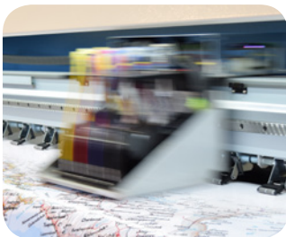
Szybki druk do 260 m 2 /h